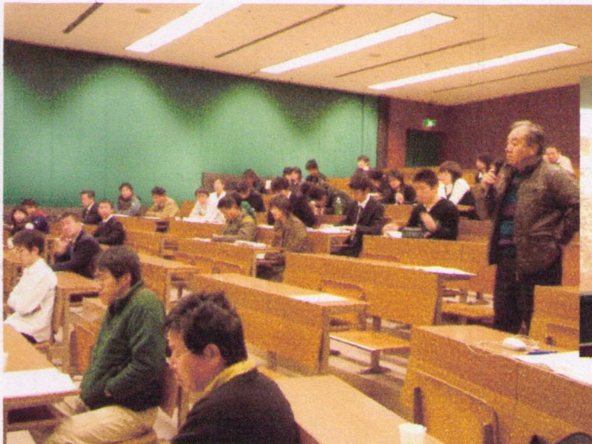
↑質問が飛び交う会場内