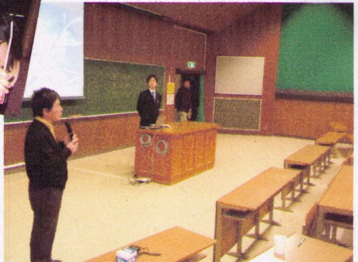
↑開会のあいさつ(福山センター長)