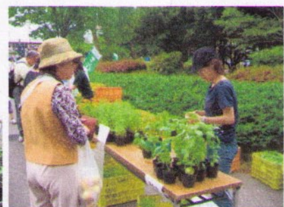
↑昨年のキャンパス市の様子(五十嵐)