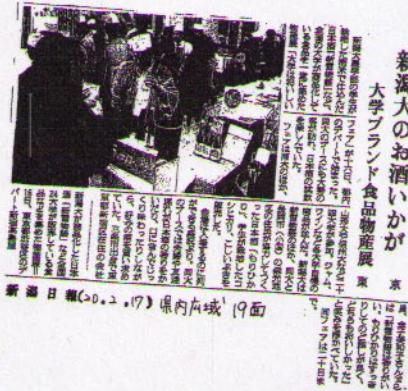
↑新聞にも掲載されました