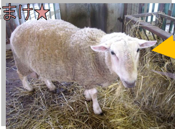
最近(9月)のヒツジ君の様子